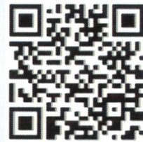
ดาวน์โหลดเอกสาร